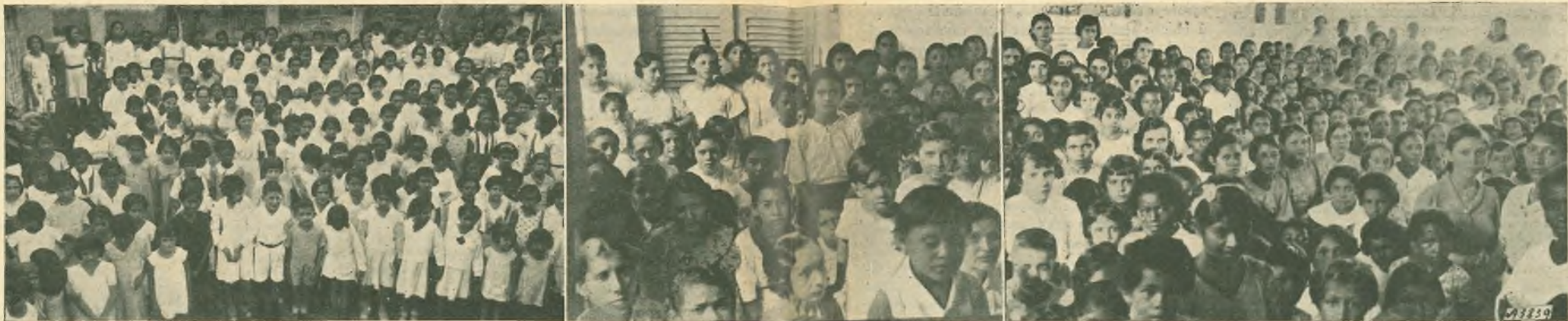
Cachoeirinha. - Istituto Professionale. - Tre istantanee delle varie sezioni di alunne.