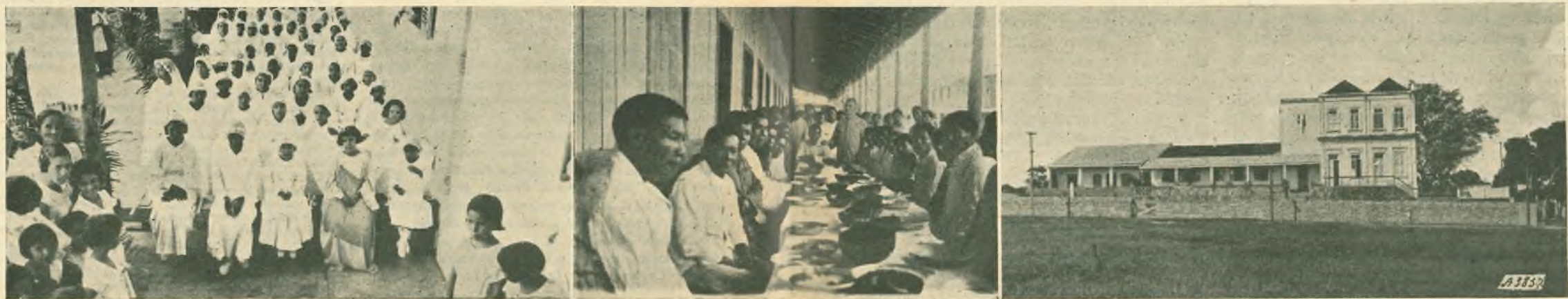
Cachoeirinha. - Le Prime Comunioni di quest'anno. — Jauareté. - Il banchetto della pacificazione: presenti 23 Capi tribù. — Cachoeirinha. - L'edificio attuale dell'Istituto Professionale.

Nella città di Manáos, sulla sponda destra del Rio Negro, havvi un immenso rione di circa 18.000 abitanti, chiamato Cachoeirinha. Il popolo era abbandonato, senza preti, senza