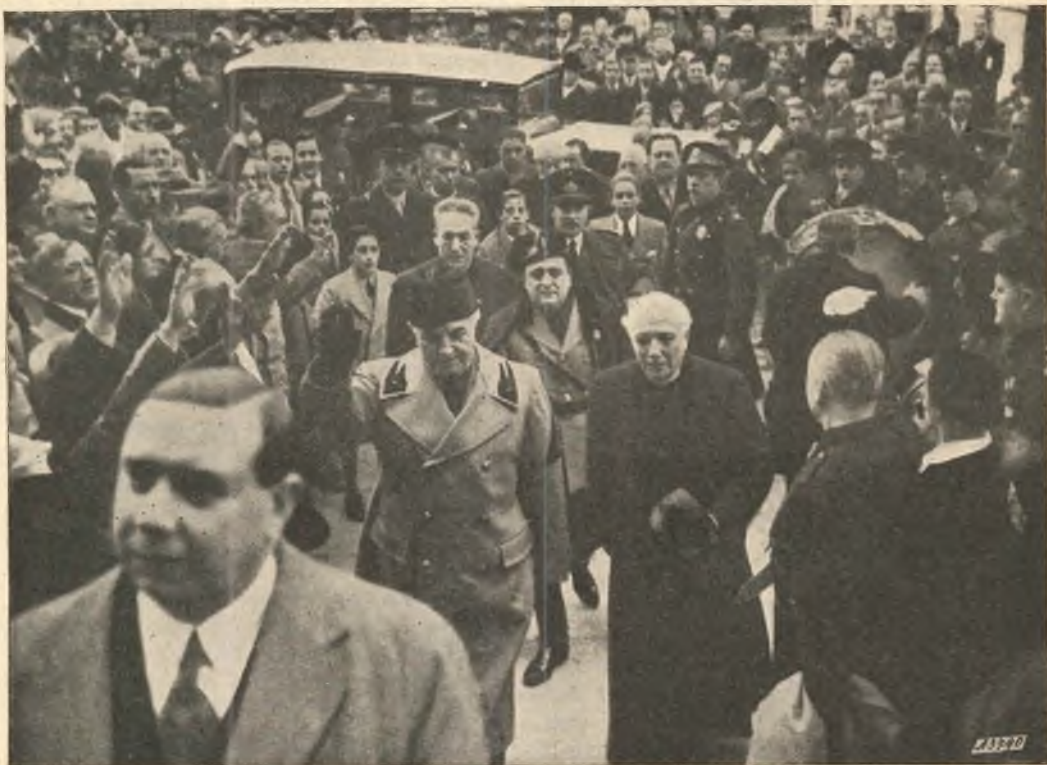
Buenos Aires. - S. E. Luigi Federzoni al Collegio Salesiano Pio IX.