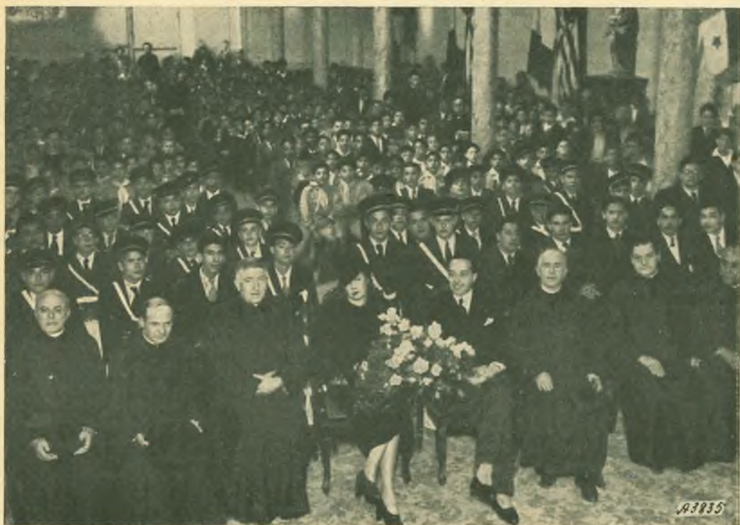
Lima (Perù). - Il Ministro d'Italia riceve l'omaggio del nostro collegio di Piura.