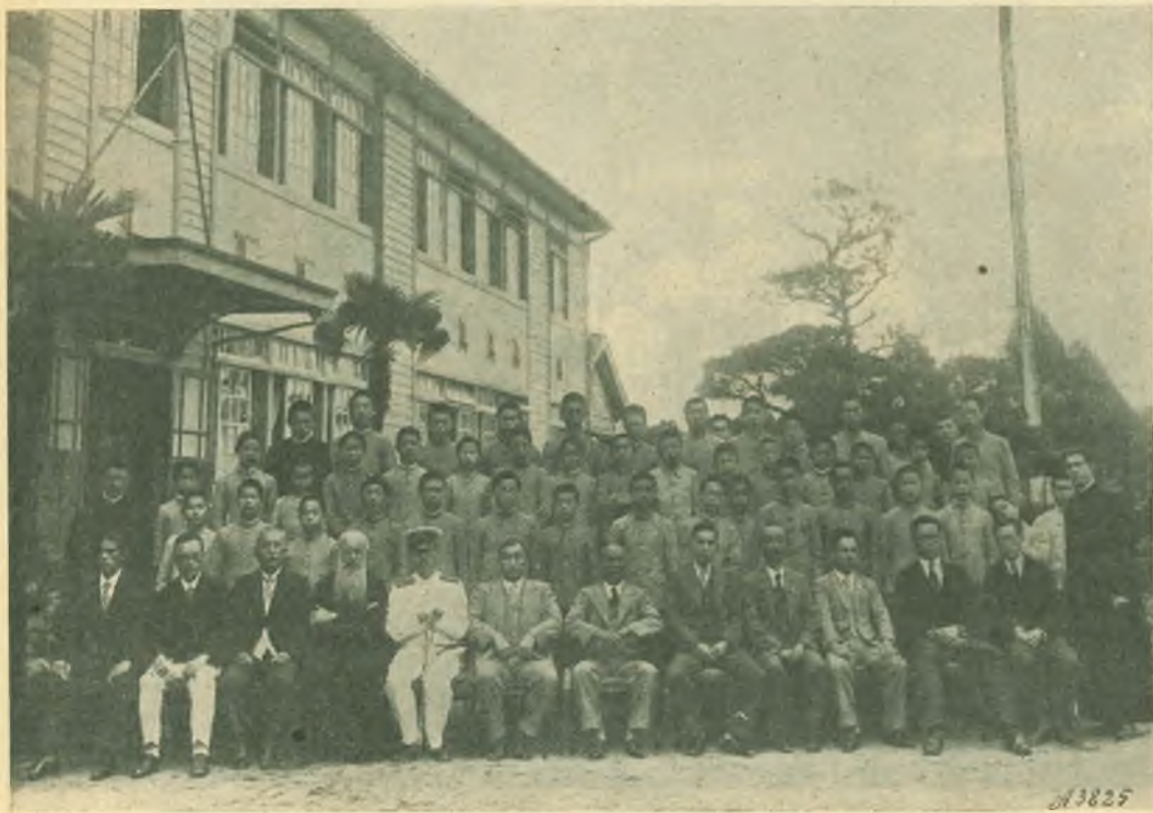
Miyazaki (Giappone). - Le autorità intervenute all'inaugurazione della bandiera