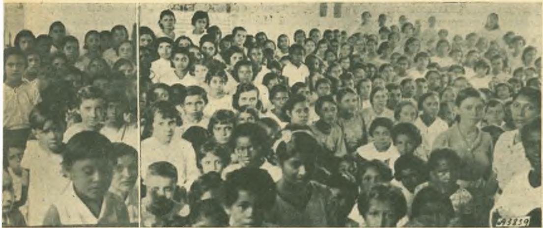
stantanee delle varie sezioni di alunne.