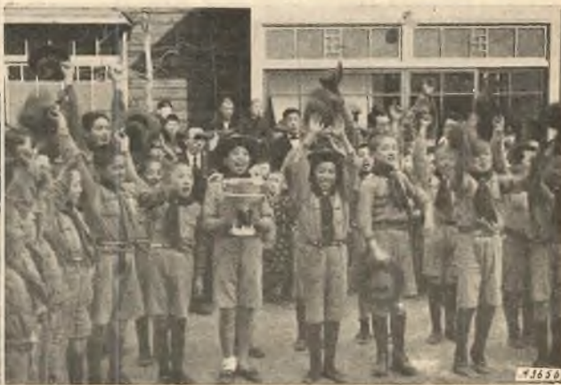
Fanfara e sport nelle nostre Missioni in Giappone.