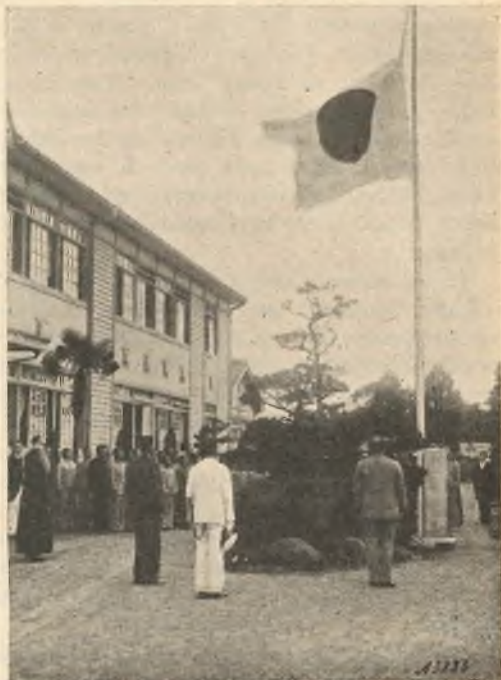
Miyazaki (Giappone). - L'alza bandiera

Si pubblica pure il settimanale Katei no tenshi (Angelo delle famiglie), specie a utilità dei cristiani sparsi per la Missione, che così possono alla domenica leggere la spiegazione del Vangelo, del Catechismo e le notizie più importanti della Missione. Edite dalla «S. Maria» sono pure in via di formazione una serie di pubblicazioni destinate a spargere la parola della carità fra i poveri pagani, e anche il