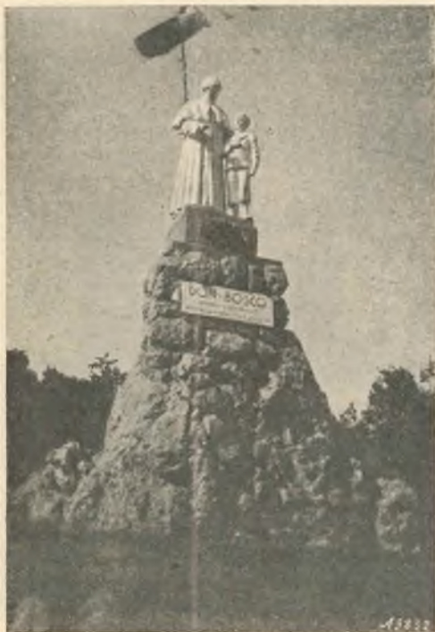
Settefrati. - Il monumento a S. Giovanni Bosco eretto dai nostri aspiranti missionari di Gaeta.

La benedizione impartita dai due Ecc.mi Vescovi coronò il riuscito convegno.