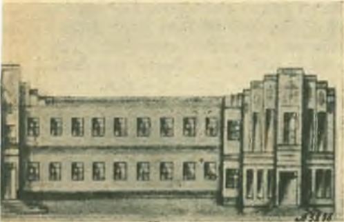
nto del nuovo Istituto Professionale

vaneite e con un moderno Giardino d'Infanzia dall'alto della collina di Porto Velho troneggia ora in un grande edificio dalle linee eleganti.