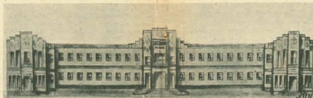
Cachoeirinha (Rio Negro - Brasile). - Progetto del nuovo Istituto Professionale

male, che il Governo ha pareggiato per l'interno dello Stato. Diretta dalle benemerite Figlie di Maria Ausiliatrice con oltre 250 gio-