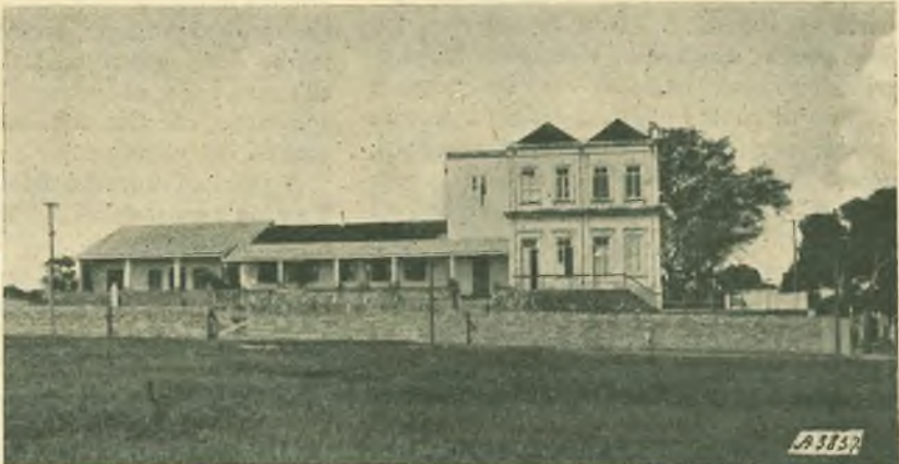
azione: presenti 23 Capi tribù. — Cachoeirinha. - L'edificio attuale dell'Istituto Professionale.