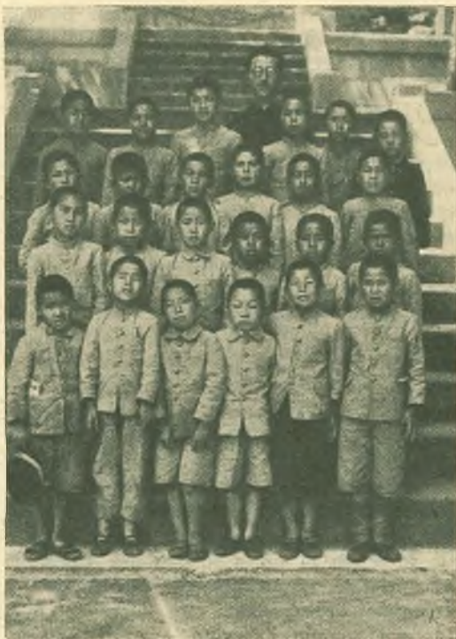
Nakatsu (Giappone). - I piccoli aspiranti