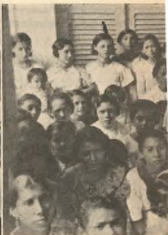
Cachoeirinha. - Istituto Professionale. - Tre