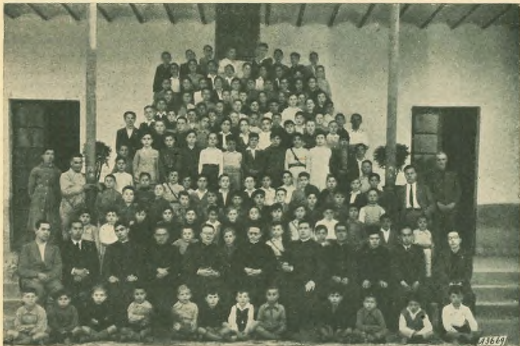
Ronda (Spagna). - Altri Salesiani hanno sostituito i confratelli massacrati dai comunisti ed hanno riaperto il collegio ai superstiti figli del popolo.

Chiuse l'Arcivescovo esortando ad onorare in S. G. Bosco il precursore dell'Azione cattolica, richiamando, raccomandando, benedicendo le proposte fatte e le deliberazioni prese.