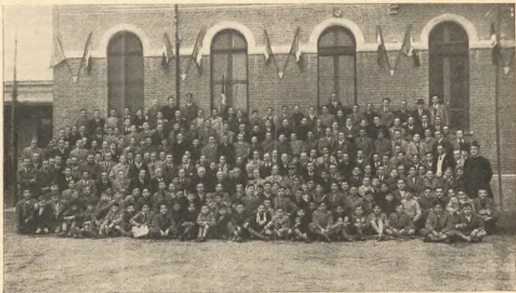
Oratori fiorenti: l'Oratorio D. Bosco di Asti.

Una bella grazia. — Facevo il noviziato tra le Suore della Carità, a Borgaro Torinese, quando fui disturbata da dolori di testa causati da un mal d'orecchio.